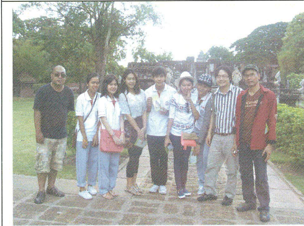
เรียนรู้ศิลปวัฒนธรรมร่วมอาเซียน: ปราสาทหินพิมาย