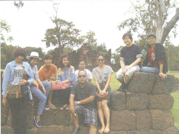
เรียนรู้ศิลปวัฒนธรรมร่วมอาเซียน: ปราสาทเป็อยน้อย