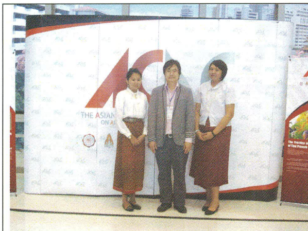
The Asian Conference on Arts and Culture 2013