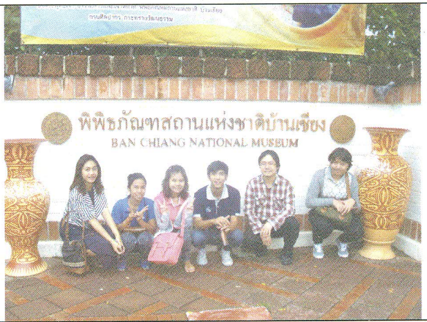
เรียนรู้ศิลปวัฒนธรรมร่วมอาเซียน: มรดกโลกบ้านเชียง