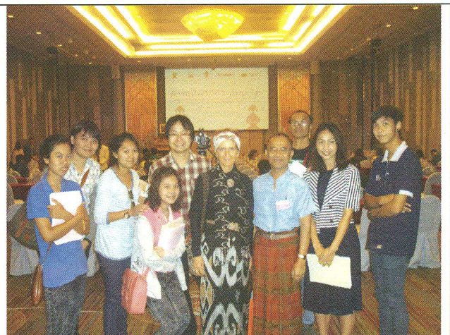
ประชุมทางวิชาการระดับชาติ "ผ้าทอในวิถีชีวิตไทย-ไท"