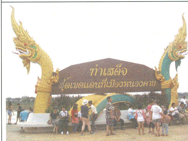
เรียนรู้ศิลปวัฒนธรรมร่วมอาเซียน: ตลาดอินโดจีนท่าเสด็จ