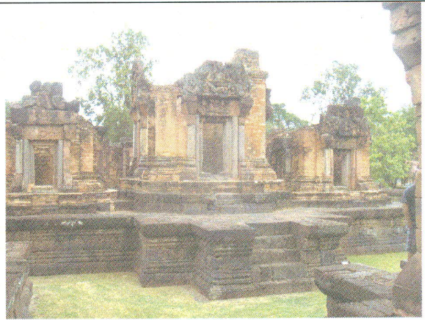
เรียนรู้ศิลปวัฒนธรรมร่วมอาเซียน: ปราสาทเป็อยน้อย

กรณีเป็นโครงการบริการวิชาการแก่ชุมชน ขอให้ผู้รับผิดชอบโครงการ/กิจกรรม ระบุข้อมูลในข้อ 16 พร้อมแนบหลักฐานประกอบด้วย